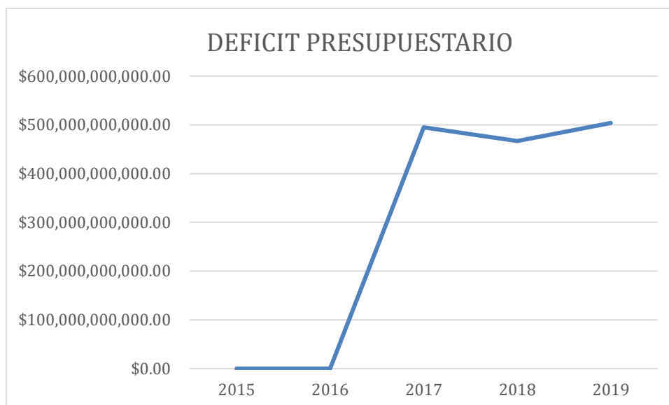
Grafica 2. Déficit presupuestario 2015-2019

Fuente: Elaboración propia a través de los datos proporcionados en los Presupuestos de Egresos